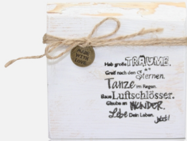
Träume | -01

„Sprüchklötzle“ groß / Art.Nr. 60 15 00- / Höhe ca. 11 cm Breite ca. 11 cm / weiß gekalkt aus Massivholz