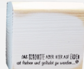
Schönste! | -05

„Sprüchklötzle“ klein / Art.Nr. 60 14 99- / Höhe ca. 6,5 cm Breite ca. 6,5 cm / weiß gekalkt aus Massivholz