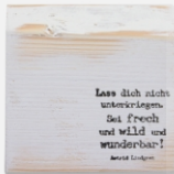
Wunderbar | -02

„Sprüchklötzle“ groß / Art.Nr. 60 15 00- / Höhe ca. 11 cm Breite ca. 11 cm / weiß gekalkt aus Massivholz