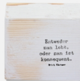
Leben | -04