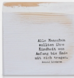
Kindheit | -01