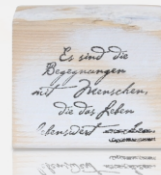
Begegnungen | -06